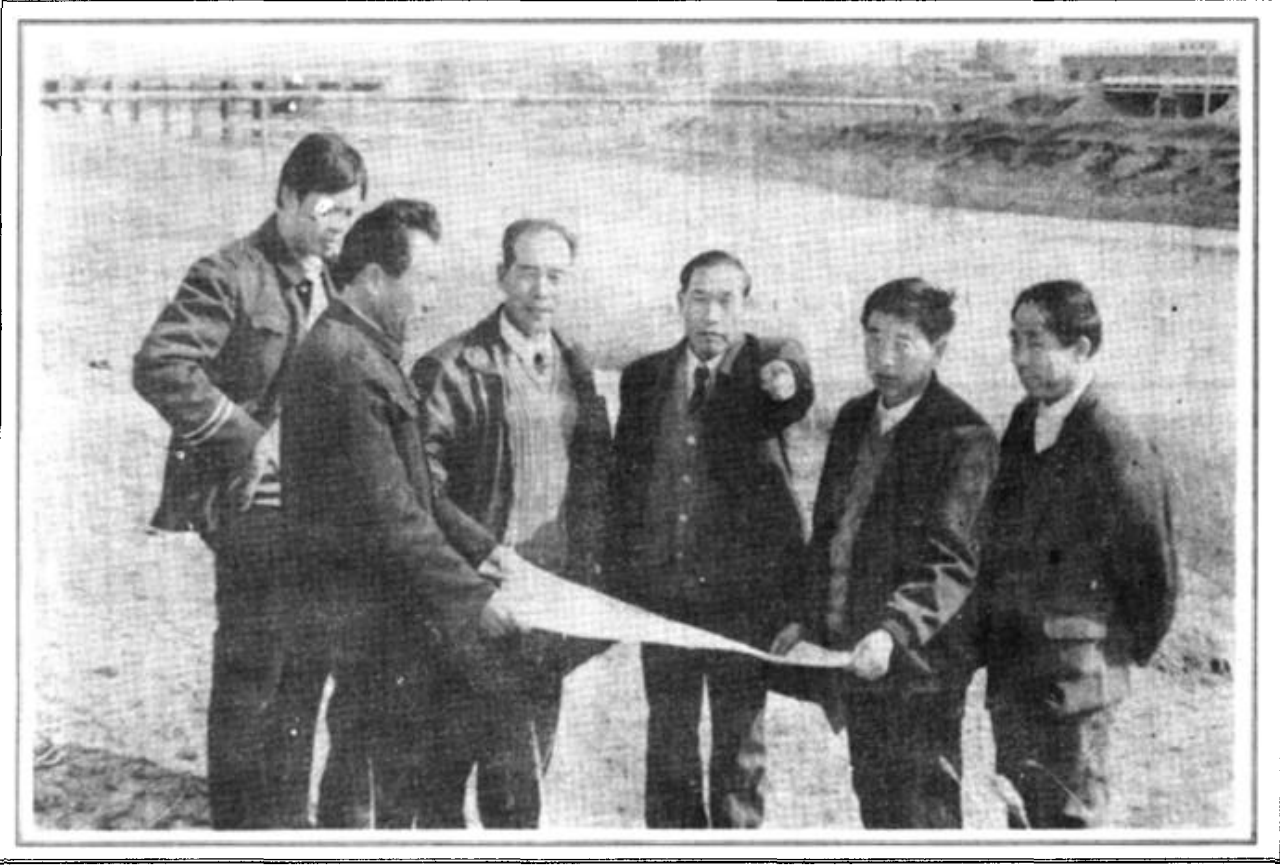
图为市水利局、广利河绿化指挥部的领导同志在研究广利河的绿化工作。

三、在管理上要有硬措施。河道绿化，种植是基础，管理是关键。我们要加大投入，做到种好树，管护好。其管理措施思路有：一是随着管护房的建成，由河道管理机构实施统一管理，考察招聘管护队伍，签订合同，实行责任制，真心做到栽好树，管好树。二是征得市政府的支持，颁布搞好广利河管理的通告，教育引导广大干部群众自觉遵守河道管理法规，爱护河道设施与林木，防止破坏现象发生。三是充分发挥河道主管机关的职能作用，实行主管与联防相结合的体制，把林木管理与河道管理结合起来，真正发挥河道的综合效益。四是依法管河，依法治河，使河道管理逐步步入法制建设的正确轨道。 广利河的地理位置和防洪、除涝、改碱、防潮、美化市容的作用，要求我们工作求真务实，卓有成效，我们要进一步加大措施，为实现河道植树基地化，管理规范化，城市美容化而努力奋斗。